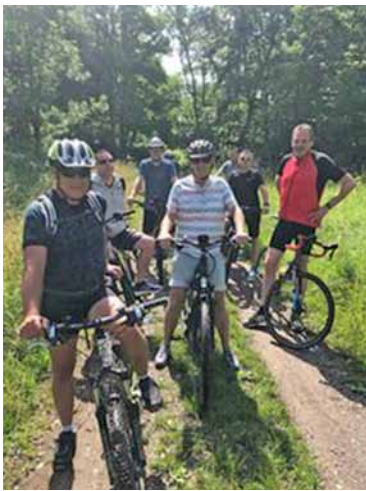
Auf der Strecke.

Das unsere AH eine homogene und funktionierende Einheit ist und sie sich in diesem schwierigen Jahr nicht entmutigen lässt, zeigen auch die folgenden Aktivitäten außerhalb des Fußballplatzes.