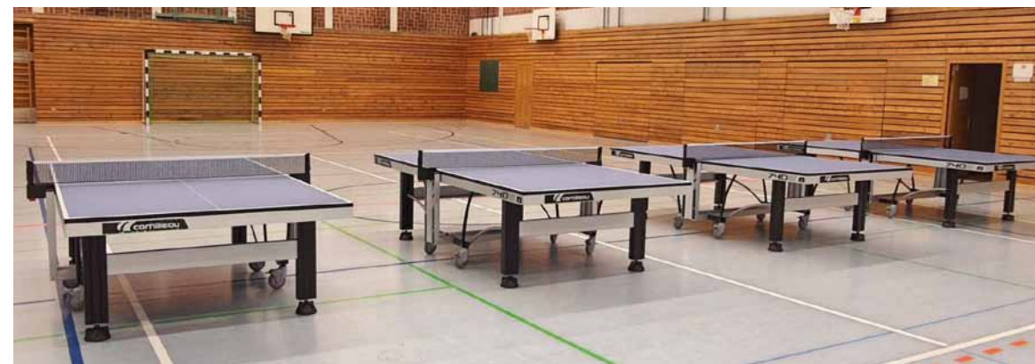
Neue Tische in der Realschule