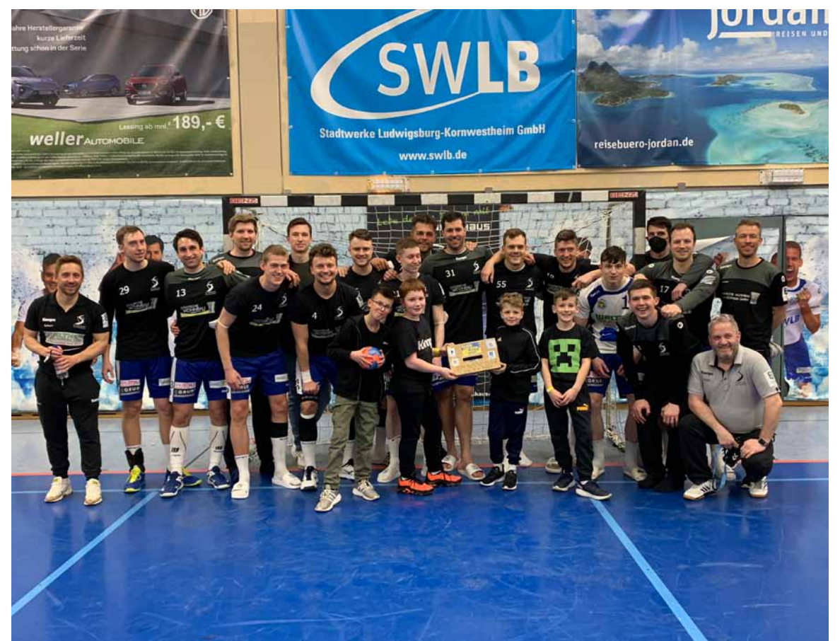
Bildunterschrift: „Die stolzen Sammler zusammen mit der ersten Mannschaft des SVK Handball“