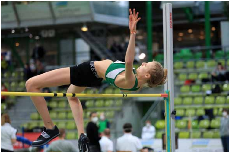
... der Höhenflug geht weiter

Nach dem äußerst erfolgreichen Jahr 2021, über das wir bereits im letzten Purzelbaum ausführlich berichtet hatten, ging es gleich zum Jahresbeginn 2022 im Höhenflug weiter.