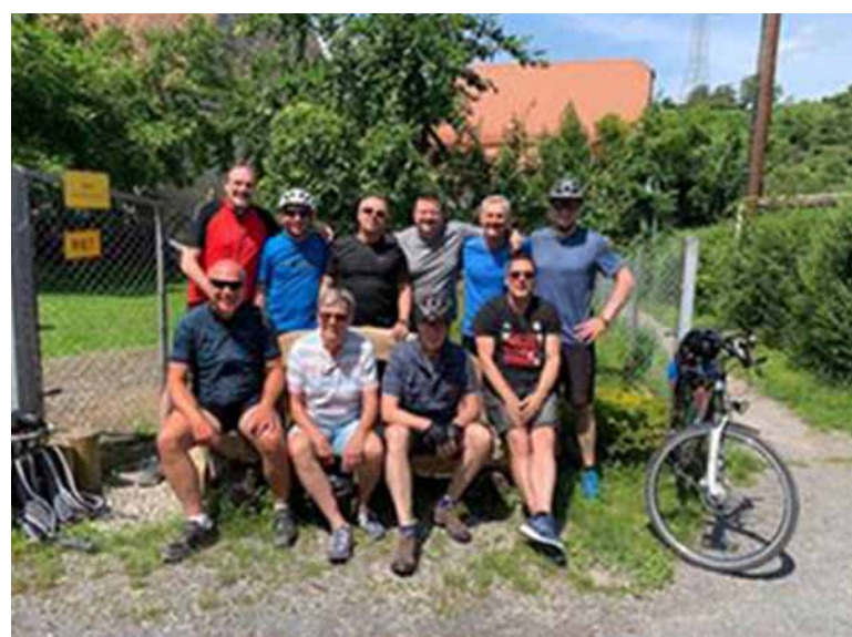
Rast in Ried.

Die Teilnehmenden hatten ausgehend von Kornwestheim einen schönen Rundkurs über Bietigheim, Sachsenheim, Vaihingen/Enz, Ried, Hochdorf, Markgröningen, Unterriexingen und wieder zurück über Bietigheim ins heimische Kornwestheim.