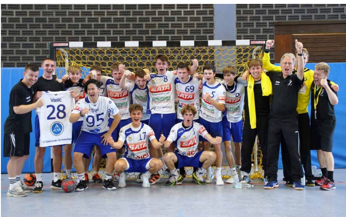
„Erfolgreich! Der Jubel nach der Qualifikation war grenzenlos“