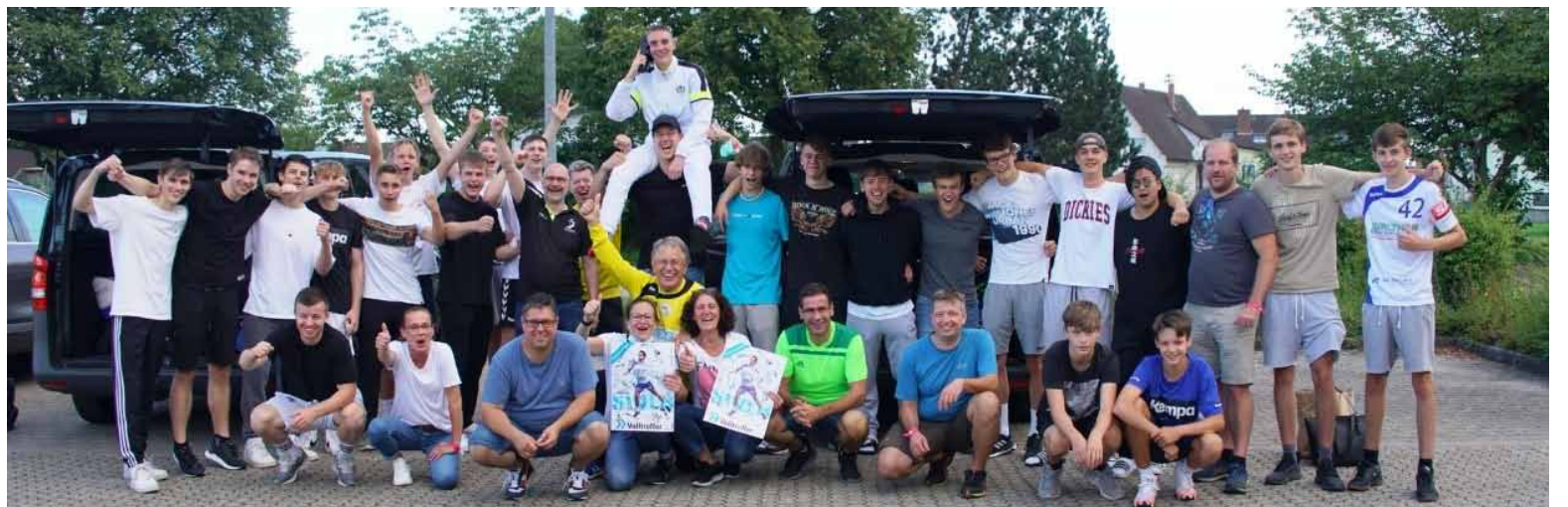
Das gesamte Team der männlichen A-Jugend freut sich über die Teilnahme an der JBLH 2021/2022

rungen zum Abenteuer JBLH befragt. Zusammenfassend kann man sagen, für das Team, die Funktionäre, die Trainer und die Fangemeinde war es eine tolle Zeit, die keiner missen möchte.