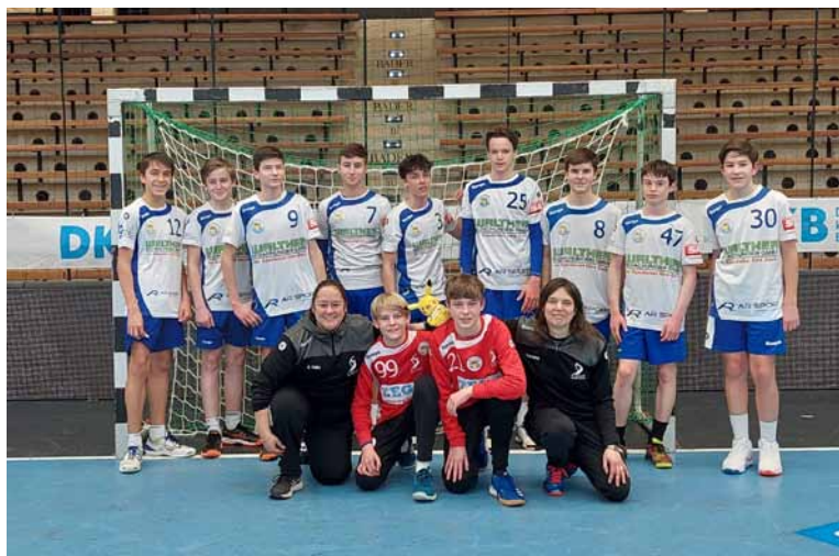
mC1 gegen Frisch Auf Göppingen in der EWS Arena