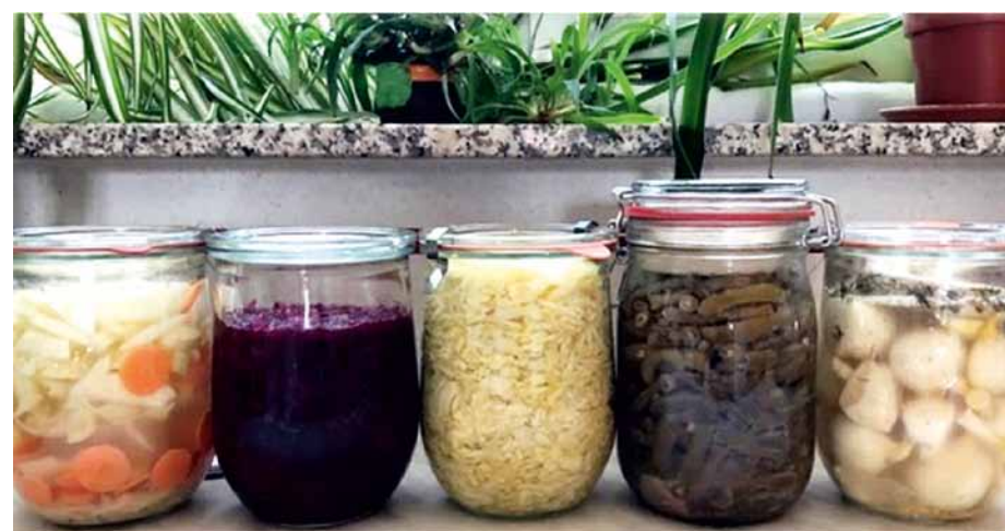
Fermentieren leicht gemacht

Der Workshop „Fermentieren von Gemüse“ gliedert sich in einen theoretischen und einen praktischen Teil. In der Theorie erfahren die Teilnehmer das Prinzip der Fermentation und vor allem die positive Wirkungsweise auf den Darm somit auf das Immunsystem und die Gesundheit. Im praktischen Teil wird Gemüse zur Fermentation vorbereitet und eingelegt. Es ist ein faszinierendes Aha-Erlebnis, das fertige Produkt dann zu verkosten.