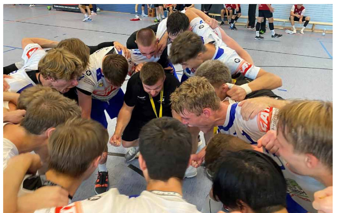
„Super – danke, Jungs für die tolle Runde“