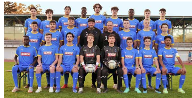
Teamfoto - A-Jugend