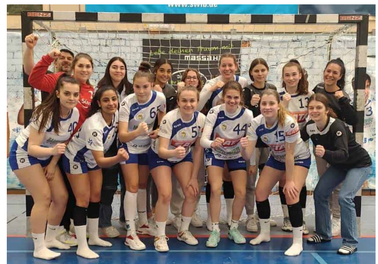
wa nach Sieg gegen Hofen/Hüttlingen